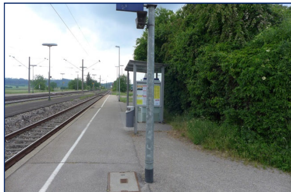
Bf Dombühl – Gleis 1